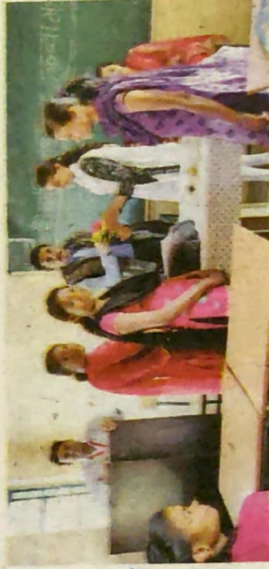
आयोजन में शामिल छात्राओं का सम्मान।